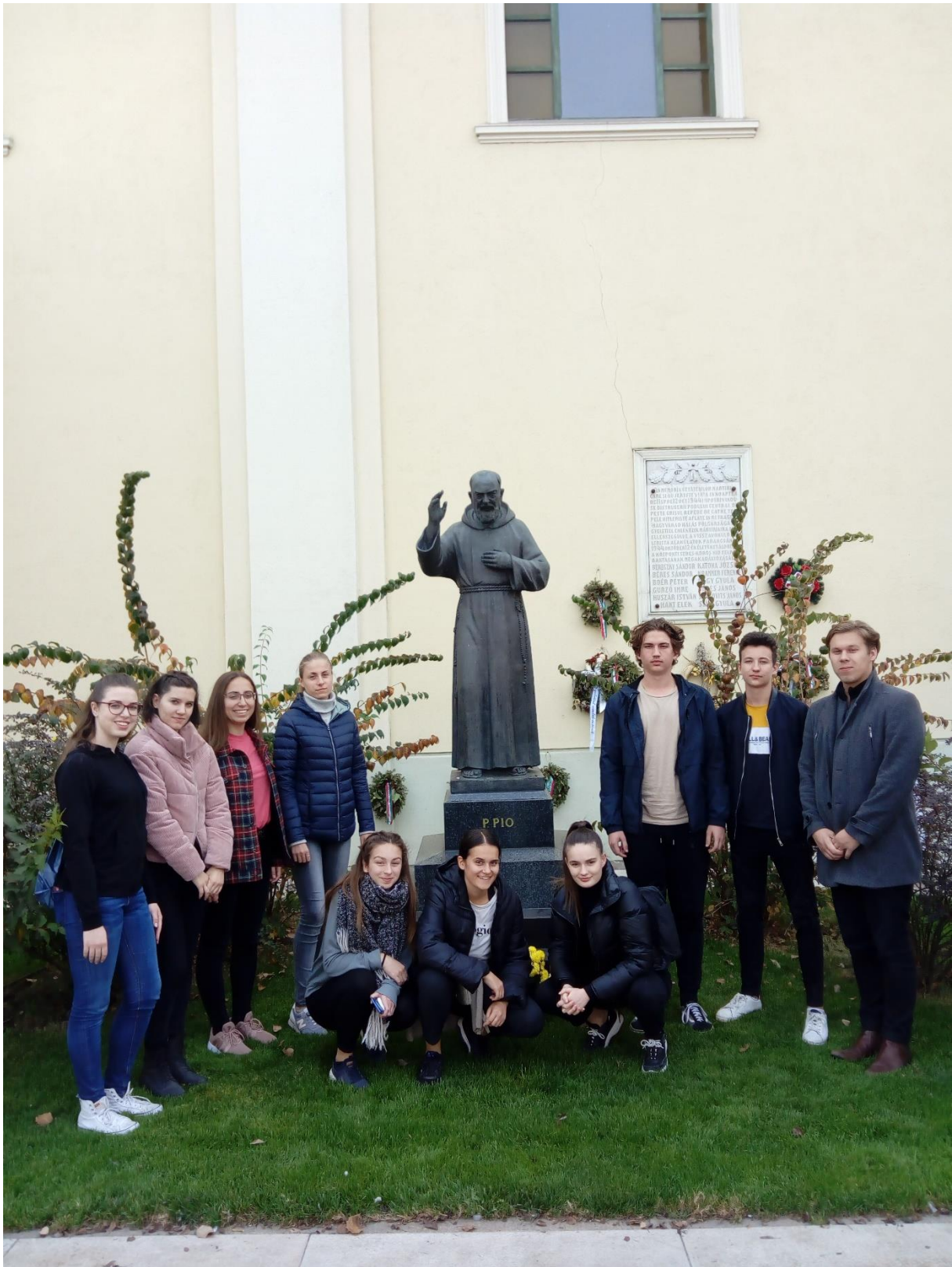
A Farkas utcai református templomban istentiszteleten (utolsó esténk Erdélyben)