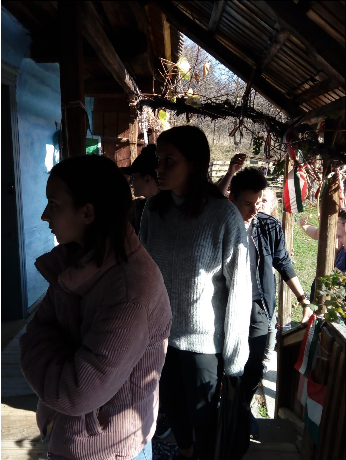
Parajdon végigjártuk a Sószorost is!