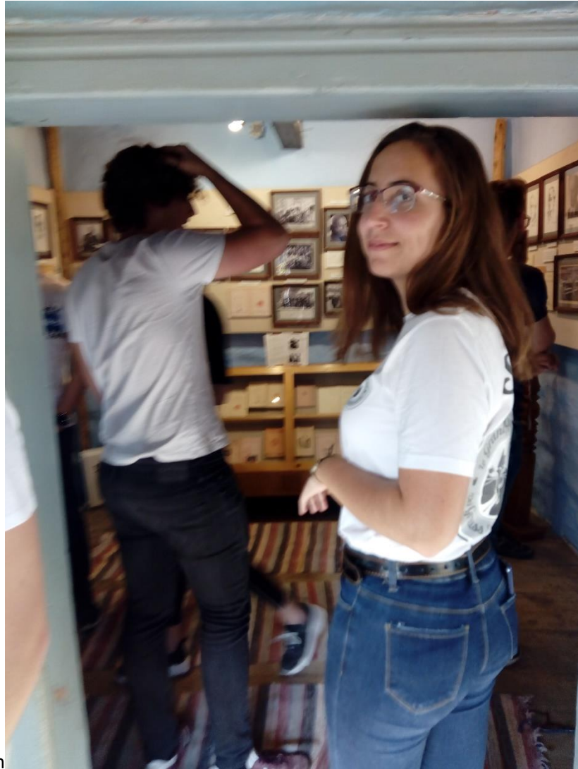
Tamási Áron szülőházában