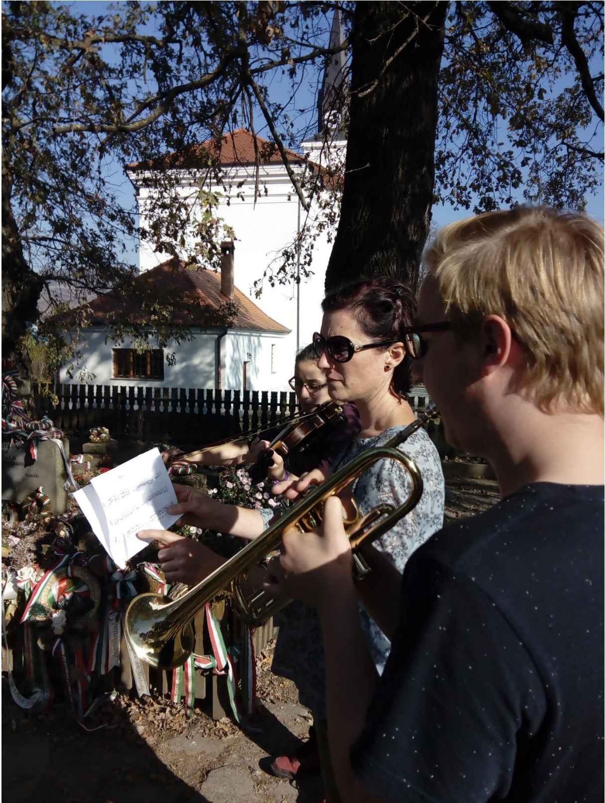
Koszorúztunk itt is...