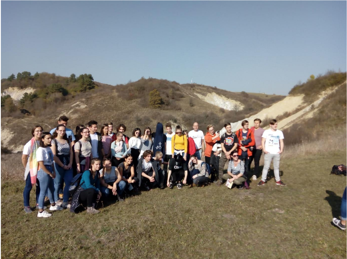
Székelykeresztúron a közös fellépésre készülve. Versek, dalok és egy Dürrenmatt-darab...